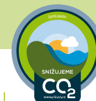
ZNAČKA SNIŽUJEME CO 2

První stupeň zapojení do programu. K získání značky je nutné prokázat existující sledování uhlíkové stopy zapojeného subjektu za poslední kalendářní rok (či více let) nebo nově sledování zahájit prvním výpočtem za uplynulý rok.