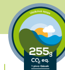
ZNAČKA UHLÍKOVÁ STOPA PRODUKTU

Druhý stupeň zapojení do programu. Značku získá subjekt, který prokáže dosažené snížení emisí skleníkových plynů ze své vlastní činnosti (za poslední rok oproti průměru celkových emisí za předchozí 3 roky).