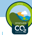
ZNAČKA OFFSETUJEME CO 2

Druhý stupeň zapojení SNIŽUJEME CO 2 rozšířený o souběžnou podporu ověřeného veřejně prospěšného offsetového projektu.