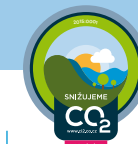
ZNAČKA SNIŽUJEME CO 2 A POMÁHÁME OSTATNÍM

Doplňující varianta k prvnímu stupni zapojení SLEDUJEME CO 2 rozšířenému o souběžnou podporu ověřeného veřejně prospěšného offsetového projektu.