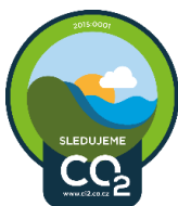
Značky SLEDUJEME CO 2