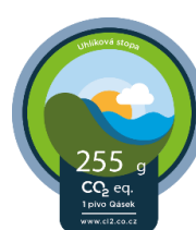
Značka UHLÍKOVÁ STOPA PRODUKTU