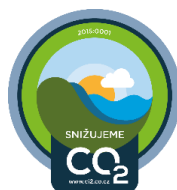
Značky SNIŽUJEME CO 2